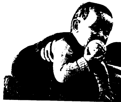
A. Aberastury: El niño y sus juegos. Paidós. B. Aires. 1968