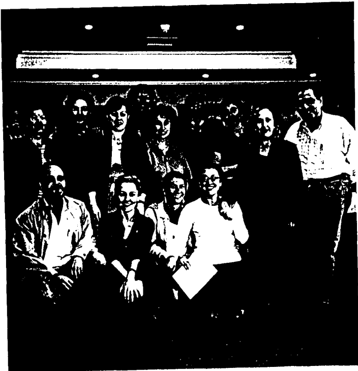
Parte de los participantes en la IV Reunión de la ASSG.